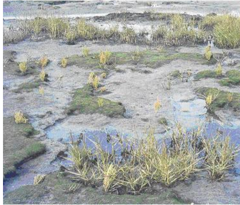
La construction du barrage anti-tempête dans l'Escaut oriental a réduit la superficie de schorres et de vadières.

Si on fermait entièrement l'Escaut, il se transformerait en un lac d'eau douce qui ne serait plus soumis à la marée et qui aurait donc des conséquences sur le milieu marin (végétal et animal) . Une commission a été formée pour palier à ce problème et a trouvé comme solution de laisser ouvert le bras de mer mais en construisant un barrage pour fermer le bras quand la sécurité des zeélandais serait menacée.