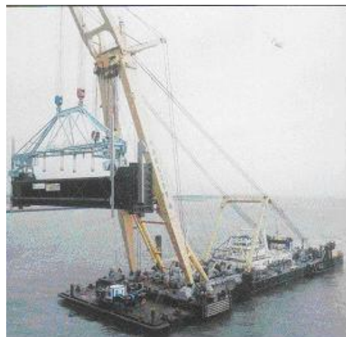
Les portes du barrage