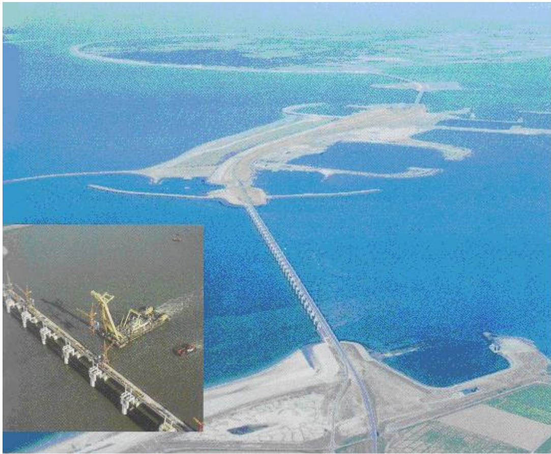
Le barrage anti-tempête achevé

C'est le 4 octobre 1986 que le barrage a été inauguré par la reine Béatrix et avec cela la fin de colossaux travaux.