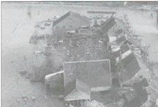
Tempête de 1953

En attendant de trouver une solution définitive à ces problèmes, ils colmatèrent vite les brèches, asséchant les terres, grâce aux progrès faits et aux enseignements antérieurs.