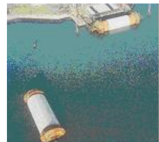
Matelas posé dans le fond de la mer