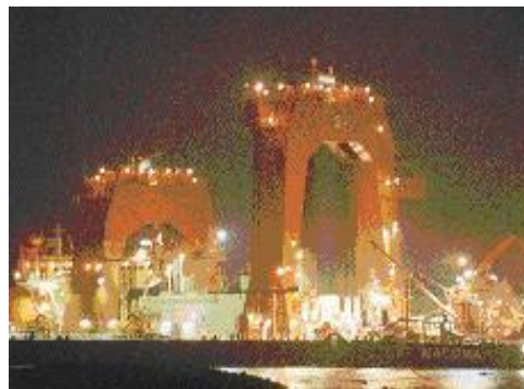
Le bateau Ostrea qui place les piles