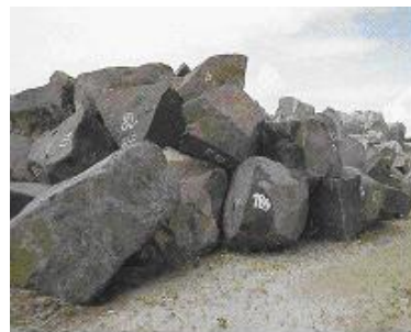
Les enrochements placés de part et d'autre des piles