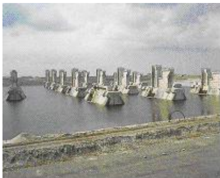
Les piles des barrages achevées dans le puits de construction

La fermeture de tous les bras de mer s'est déroulée en 25 ans.