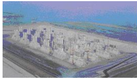
Les piles des barrages achevées dans le puit de construction