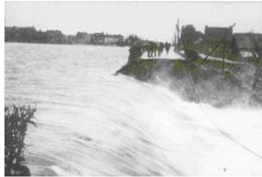
Les digues se rompirent en nombreux endroits